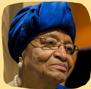
Ellen Johnson Sirleaf

La session d'ouverture donne le ton à ce sommet de 5 jours avec les discours d'ouverture des The Elders, d'un ministre de la justice de la région d'Afrique de l'Ouest, d'un acteur de la justice de base et d'un membre de la Task Force sur la justice - chacun d'entre eux soulignant l'importance de la collaboration régionale pour faire avancer le programme de justice pour tous.